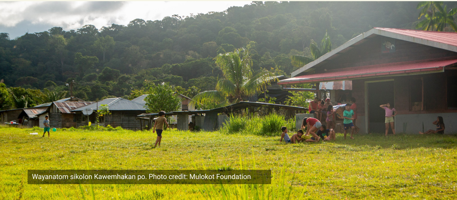
Wayanatom sikolon Kawemhakan po.

ëutë umiitintomoja mënëtuja. Ipëkhe eitop malalë ontwikkeling alëtop man upaklë ëutë umiitintomoja tipetukwai ëtakëlë stichting alitom malë Wayanatomelë. Awomikom man “emna malëla aptao, emna pëkëla” tiwëlënkom tuwalë eitohme epoleken Wayanatom ënekwalikala eitohme, Wayanatom malë ëtikom pëkhe aptao ëhekatip eitop ailë Wayanatom tilespekiptëi tëpëtomai mihja ëtakëlë tilonkom/tipatakom kulunmatohme ejahe.