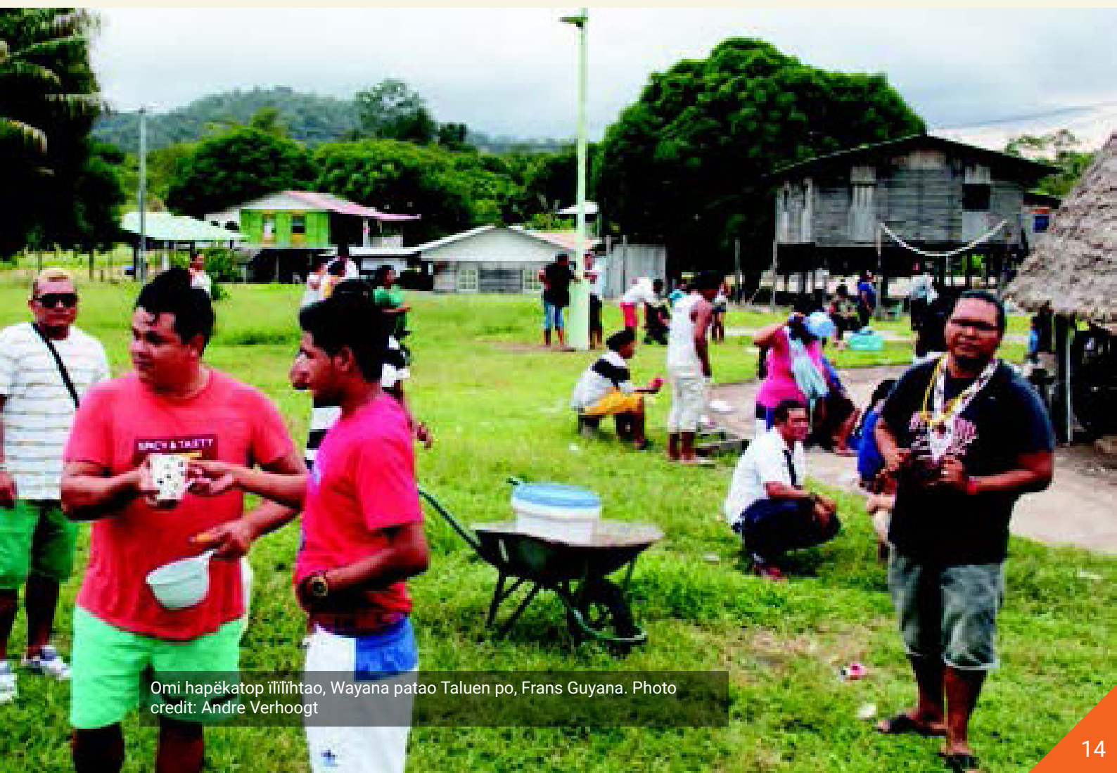
Omi hapëkatop iil'it'htao, Wayana patao Taluen po, Frans Guyana.