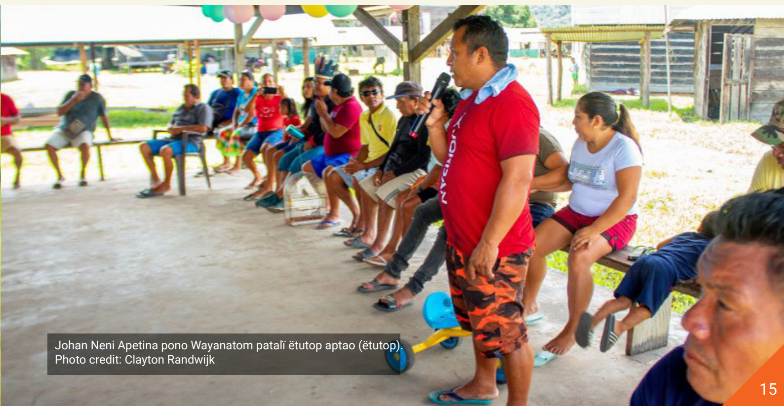
Johan Neni Apetina pono Wayanatom patali ētutop aptao (ētutop).