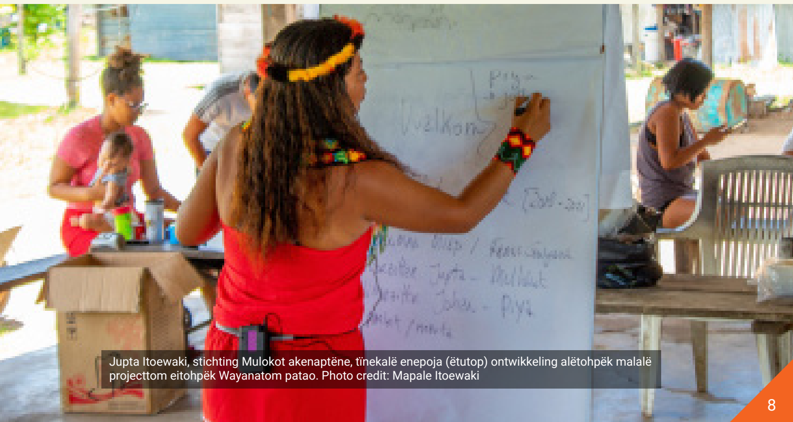
Jupta Itoewaki, stichting Mulokot akenaptēne, tīnekalē enepoja (ētutop) ontwikkeling alētohpēk malalē projecttom eitohpēk Wayanatom patao.