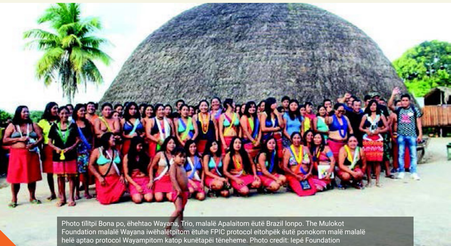
Photo tilitpi Bona po, ëhehtao Wayana, Trio, malalë Apalaitom ëutë Brazil lonpo. The Mulokot Foundation malalë Wayana iwëhalëtpitom ëtuhe FPIC protocol eitohpëk ëutë ponokom malë malalë helë aptao protocol Wayampitom katop kunëtapëi tëneheme.