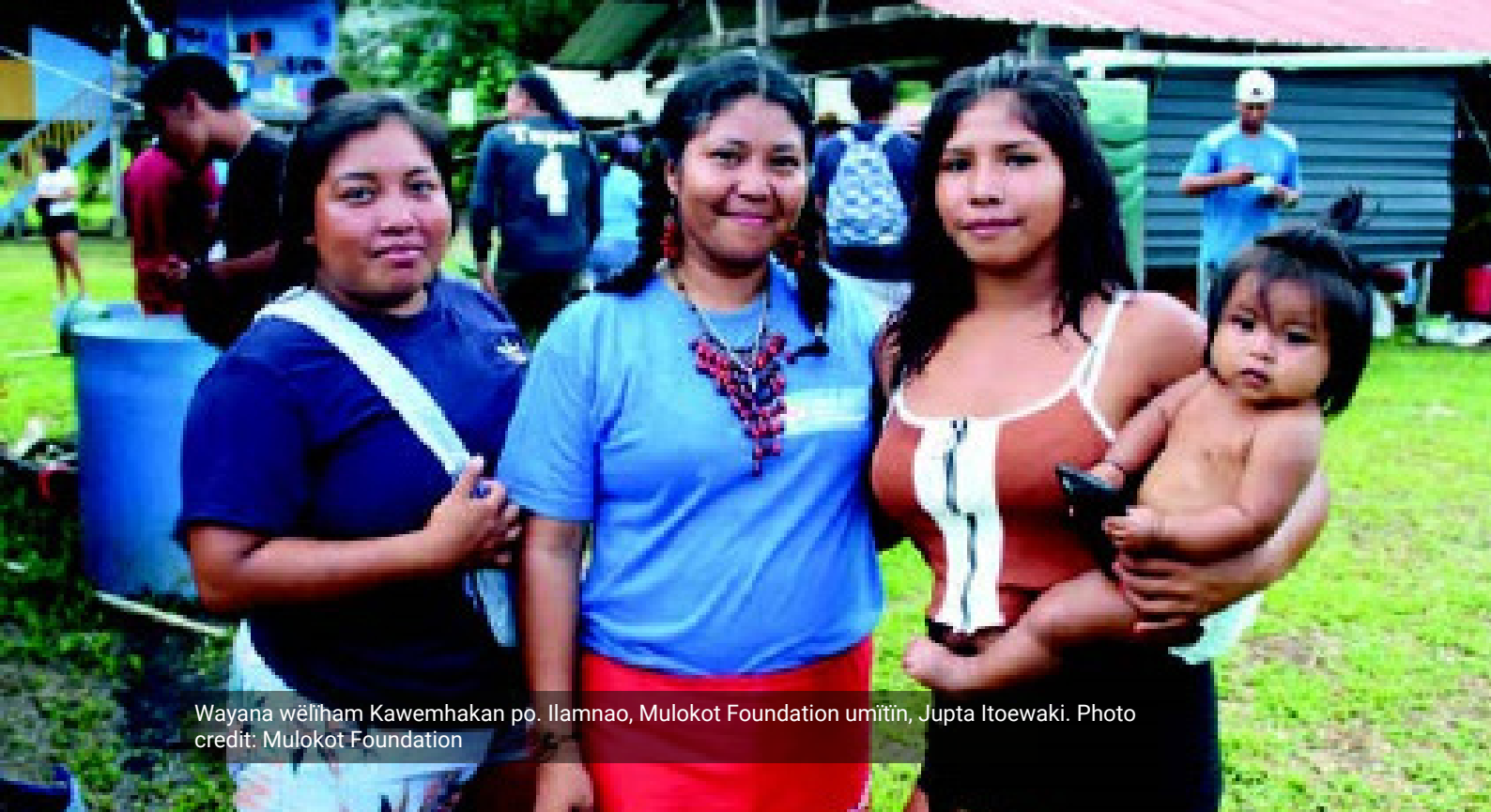
Wayana wëliham Kawemhakan po. Ilamnao, Mulokot Foundation umitìn, Jupta Itoewaki.