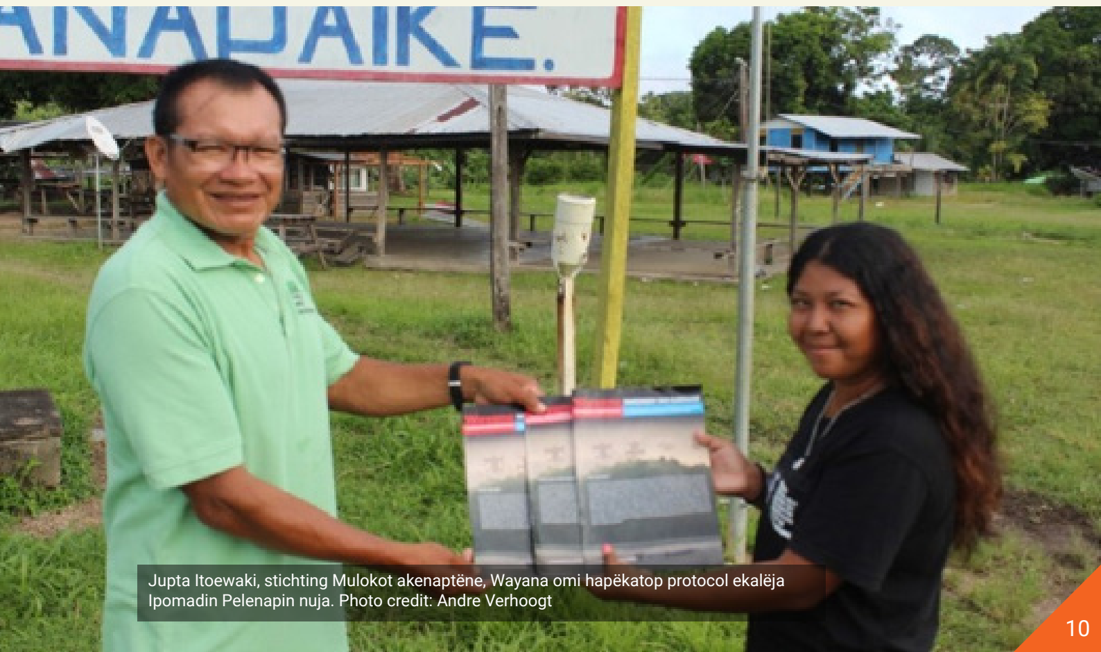
Jupta Itoewaki, stichting Mulokot akenaptëne, Wayana omi hapëkatop protocol ekalëja Ipomadïn Pelenapïn nuja.