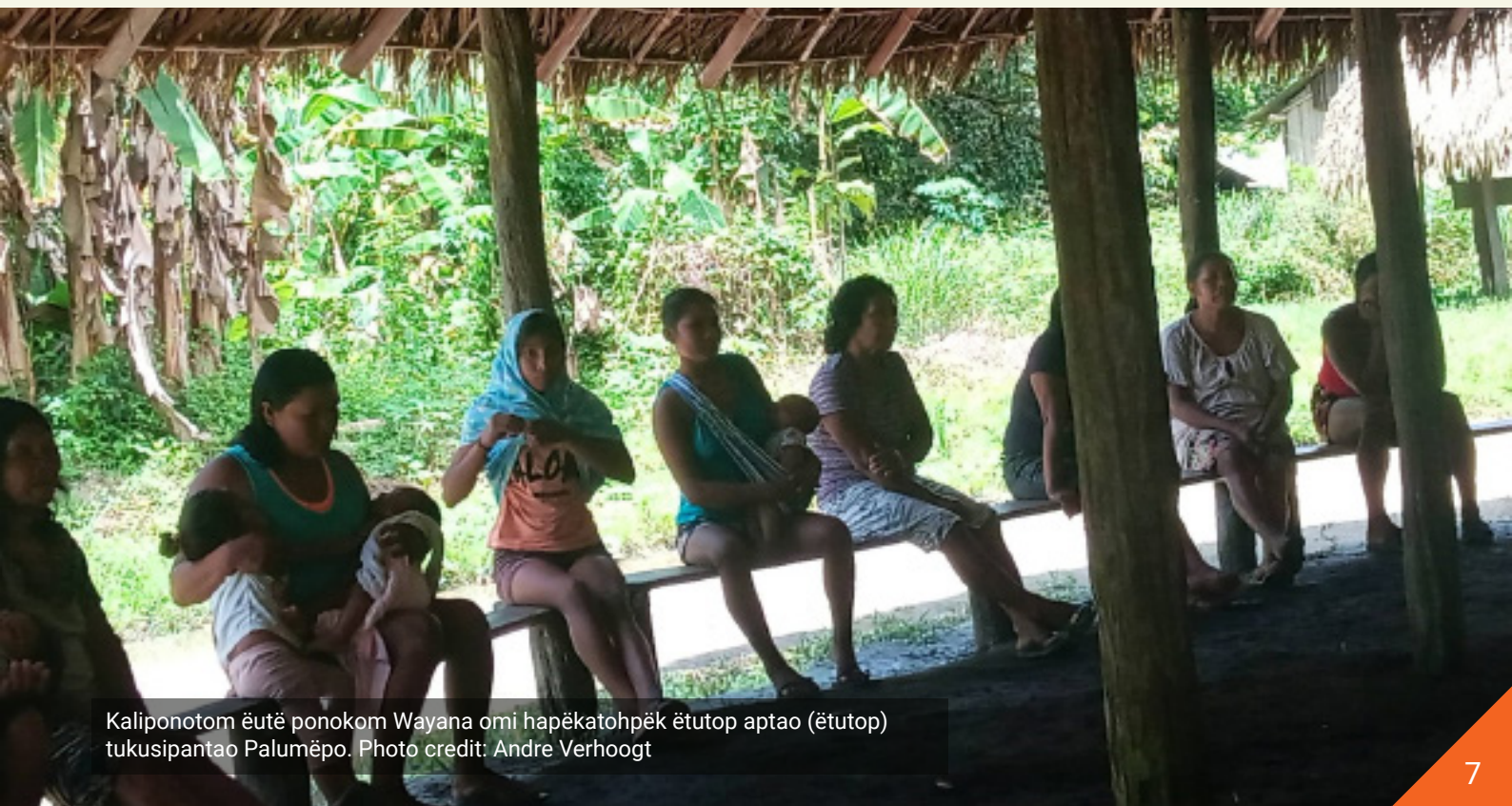
Kaliponotom ëutë ponokom Wayana omi hapëkatohpëk ëtutop aptao (ëtutop) tukusipantao Palumëpo.

eitop ailë, lome akename aptao eklohpo hapon lëken. Helë tïmoihem kunëhmilik Engels omijao, Nederlands omijao, malalë Wayana omijawëhnë talihnao iweitohme Wayanatomoja ëti eumakpelahe of tiwë tïlëmëhe aptao iloptailëla eitohme awomikomjaolë sike, masike project pëkhe tiwëlënkom aptao man epoleken ëtikom pëk eitop ipokela Wayana patao. Wantak tïkai upak Wayanatom sike towomikom hapëkanehpe sike huwa.